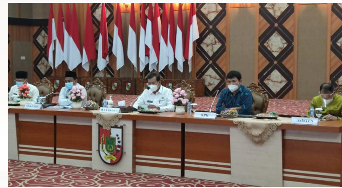
RENCANA AKSI - Walikota Pekanbaru Dr H Firdaus ST MT membuka Rapat Evaluasi Kegiatan Tahun 2020 serta rencana aksi pemberantasan korupsi terintegrasi dengan KPK dan kepala OPD se-Kota Pekanbaru.