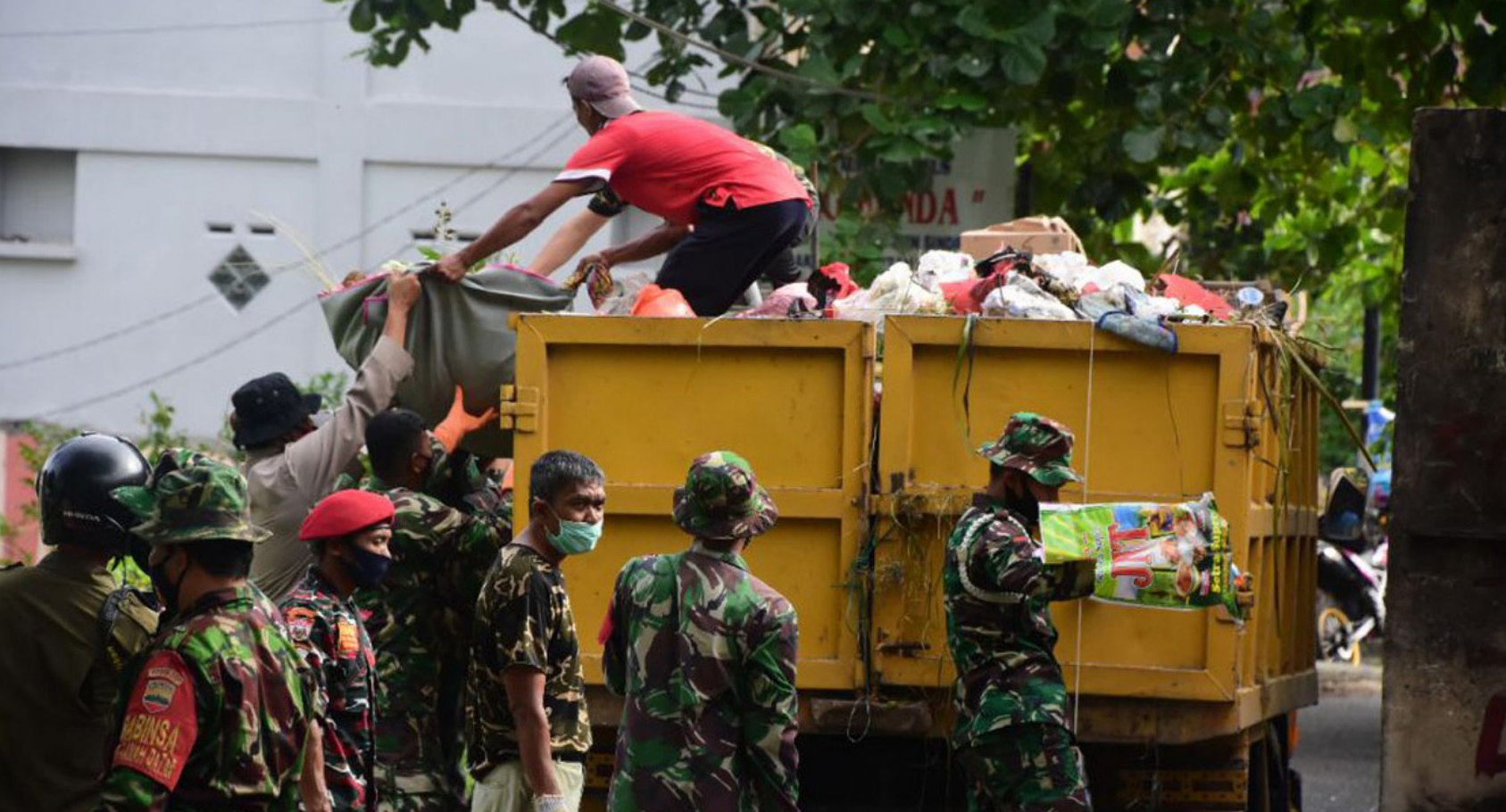
DIBANTU TNI - Personil TNI dari Korem 031/Wira Bima turut membantu membersihkan sampah yang menumpuk di jalan protokol Kota Pekanbaru.