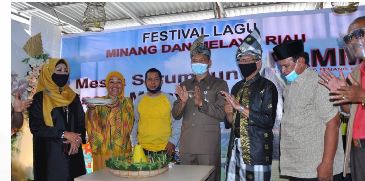
FESTIVAL LAGU - Wakil Walikota Pekanbaru H Ayat Cahyadi SSi menghadiri dan membuka Festival Lagu Minang dan Melayu Riau di Coffee Jawa Resto Jalan SM Amin Pekanbaru.