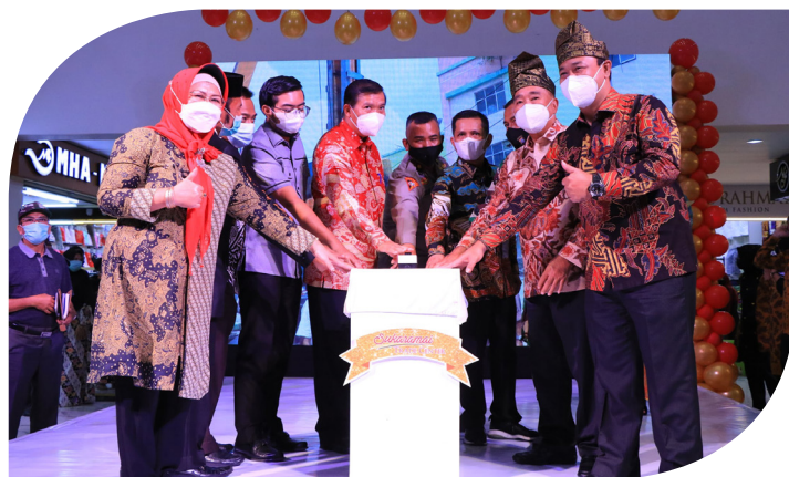
TOMBOL SIRENE - Walikota Pekanbaru Dr H Firdaus ST MT didampingi Asisten II Setdako Pekanbaru serta Forkopimda dan pengelola menekan tombol sirene saat peresmian STC.

P ASKA-kebakaran yang terjadi pada Desember 2015, Plaza Sukaramai Pekanbaru kini sudah berubah. Di atas bangunan terbakar dulu dibangun ulang dengan konsep smart building dengan nama Sukaramai Trade Center atau STC. Walikota Pekanbaru Dr H Firdaus ST MT meresmikan penggunaan STC sebagai pusat perdagangan di Provinsi Riau, dan bahkan di Asia.