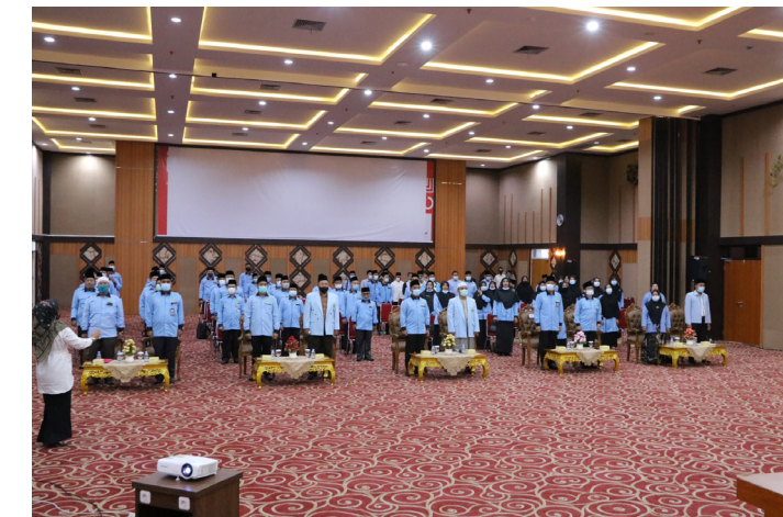
LAGU KEBANGSAAN - Seluruh pengurus DPD BKPRMI Pekanbaru dan tamu undangan menyanyikan lagu kebangsaan Indonesia Raya sebelum acara pengukuhan.

"Pekanbaru memiliki program unggulan yakni masjid paripurna. Kami ingin menjadi masjid sebagai benteng dalam kebangkitan umat membangun SDM yang unggul