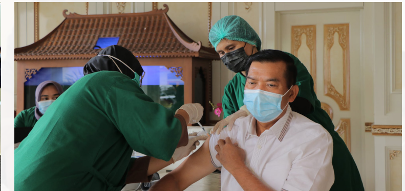
SUNTIKAN KEDUA - Walikota Pekanbaru Dr H Firdaus ST MT menerima suntikan vaksin Covid-19 tahap kedua untuk usia lanjut di Rumah Dinas Walikota Pekanbaru.