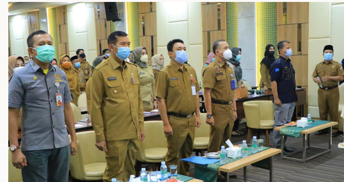
SOSIALISASI PPID - Walikota Pekanbaru Dr H Firdaus ST MT menghadiri Sosialisasi Pejabat Pengelola Informasi Dokumentasi di lingkungan Pemerintah Kota Pekanbaru di Hotel Evo Pekanbaru.