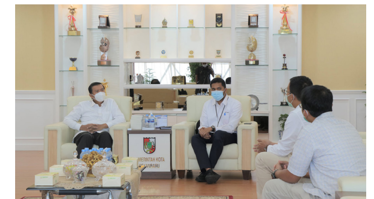
PROGRAM PLB - Walikota Pekanbaru Dr H Firdaus ST MT berdiskusi dengan rombongan dari PT Pertamina terkait program PLB dan pertashop di Kota Pekanbaru.