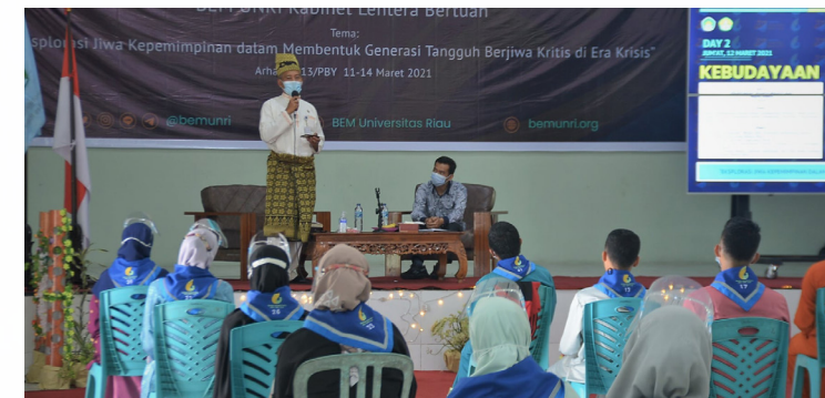
PEMATERI BEM - Wakil Walikota Pekanbaru H Ayat Cahyadi SSi menjadi pemateri kebudayaan pada Training Organization III BEM Unri Kabinet Lentera Bertuah di Aula Arhanud 13/PBY.