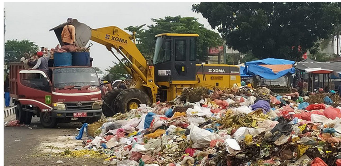
ALAT BERAT - Untuk mengurai tumpukan sampah pemerintah kota pegerahkan alat berat dalam penanganan sampah di sejumlah lokasi.