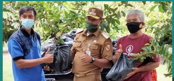
HASIL TANAMAN - Warga memperlihatkan buah-buahan hasil tanaman memanfaatkan pekarangan sekitar rumah di Kampung Iklim RW 02 Kelurahan Tobek Godang.