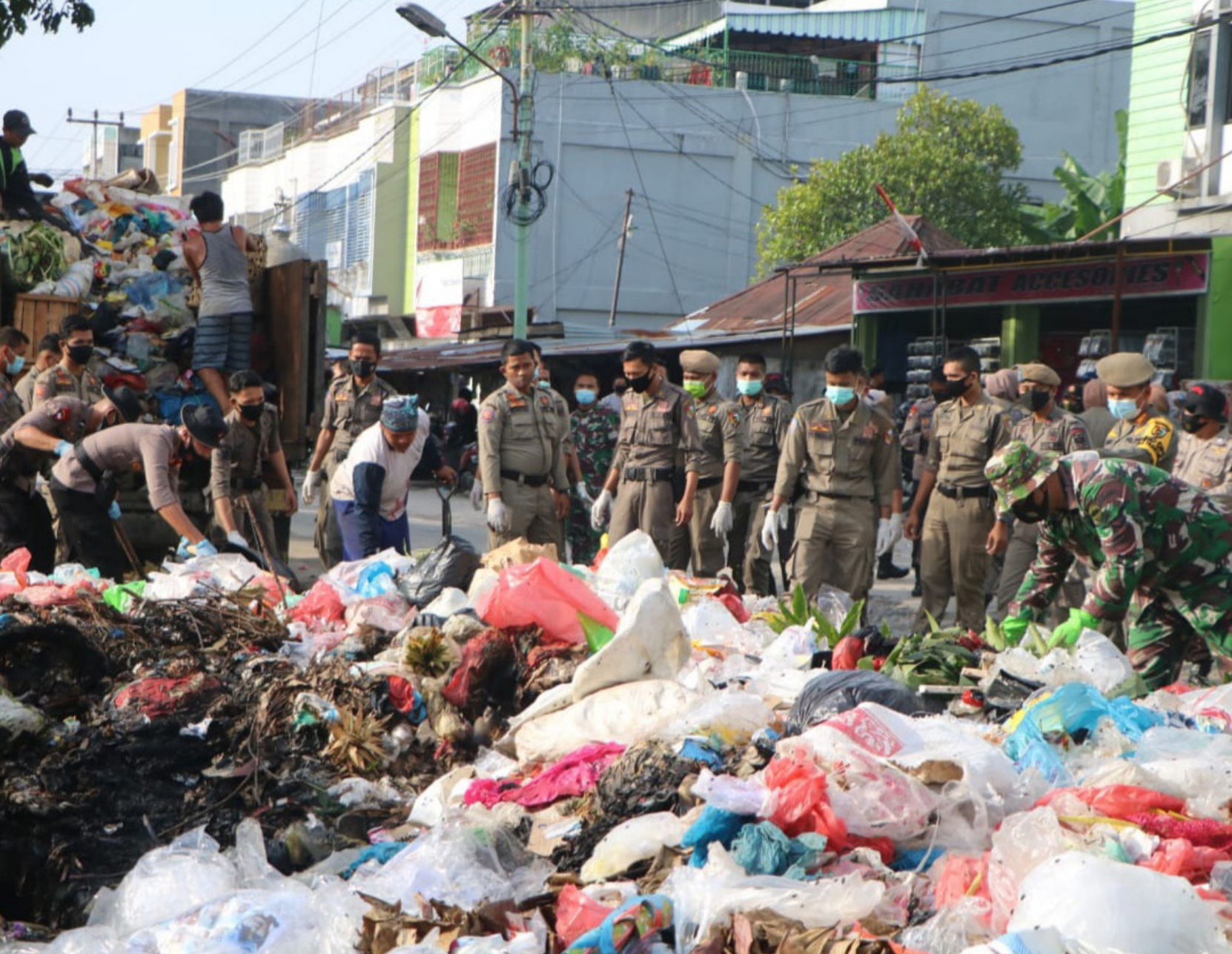
PEDULI SAMPAH - Personil Polri dan Satpol PP Kota Pekanbaru bekerja sama melakukan pengangkutan sampah. Berbagai pihak turut peduli terkait persoalan sampah.