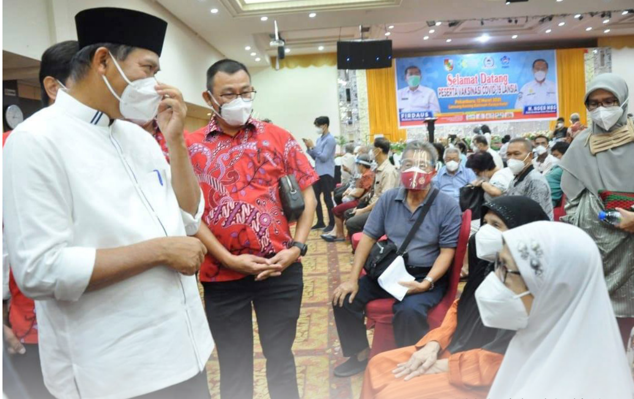
BERBINCANG - Walikota Pekanbaru Dr H Firdaus ST MT berbincang dengan beberapa orang lansia yang tengah antre untuk mendapatkan vaksinasi Covid-19.