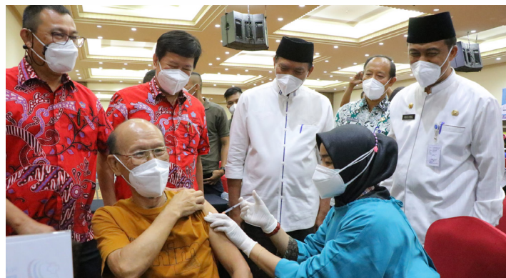
SUNTIK VAKSIN - Walikota Pekanbaru Dr H Firdaus ST MT didampingi Kepala Dinas Kesehatan Kota Pekanbaru melihat langsung proses vaksinasi yang dilakukan terhadap seorang lansia.