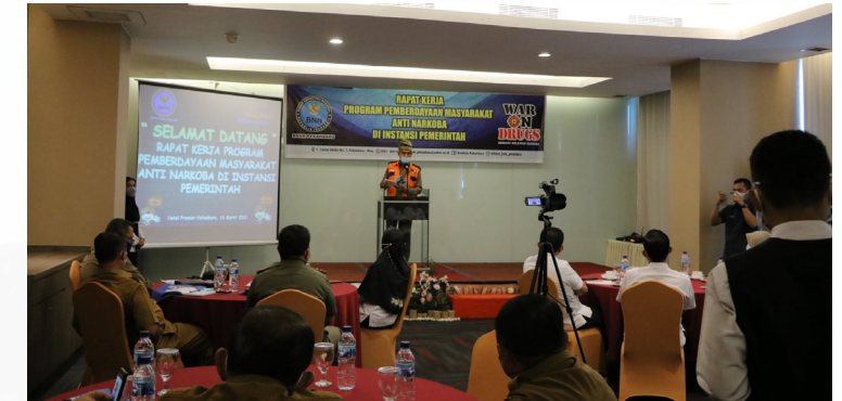
RAKER BNN - Wakil Walikota Pekanbaru H Ayat Cahyadi SSi membuka rapat kerja Program Pemberdayaan Masyarakat Anti Narkoba di Instansi Pemerintah yang ditaja BNN Kota Pekanbaru.