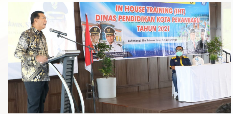
IN HOUSE TRAINING - Walikota Pekanbaru Dr H Firdaus ST MT memberi sambutan dan arahan pada kegiatan In House Training Dinas Pendidikan Kota Pekanbaru di The Balcone Hotel Bukittinggi, Sumatera Barat.