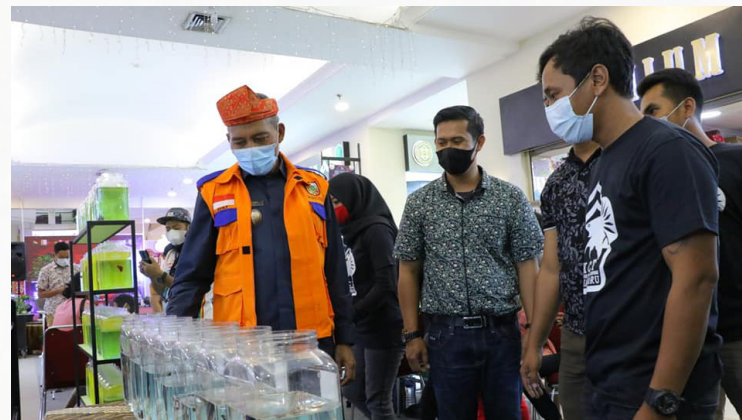
IKAN CUPANG - Wakil Walikota Pekanbaru H Ayat Cahyadi SSi melihat budidaya ikan cupang yang ditampilkan dalam kegiatan komunitas Pekanbaru Natural Aesthetic di Mal Pekanbaru.