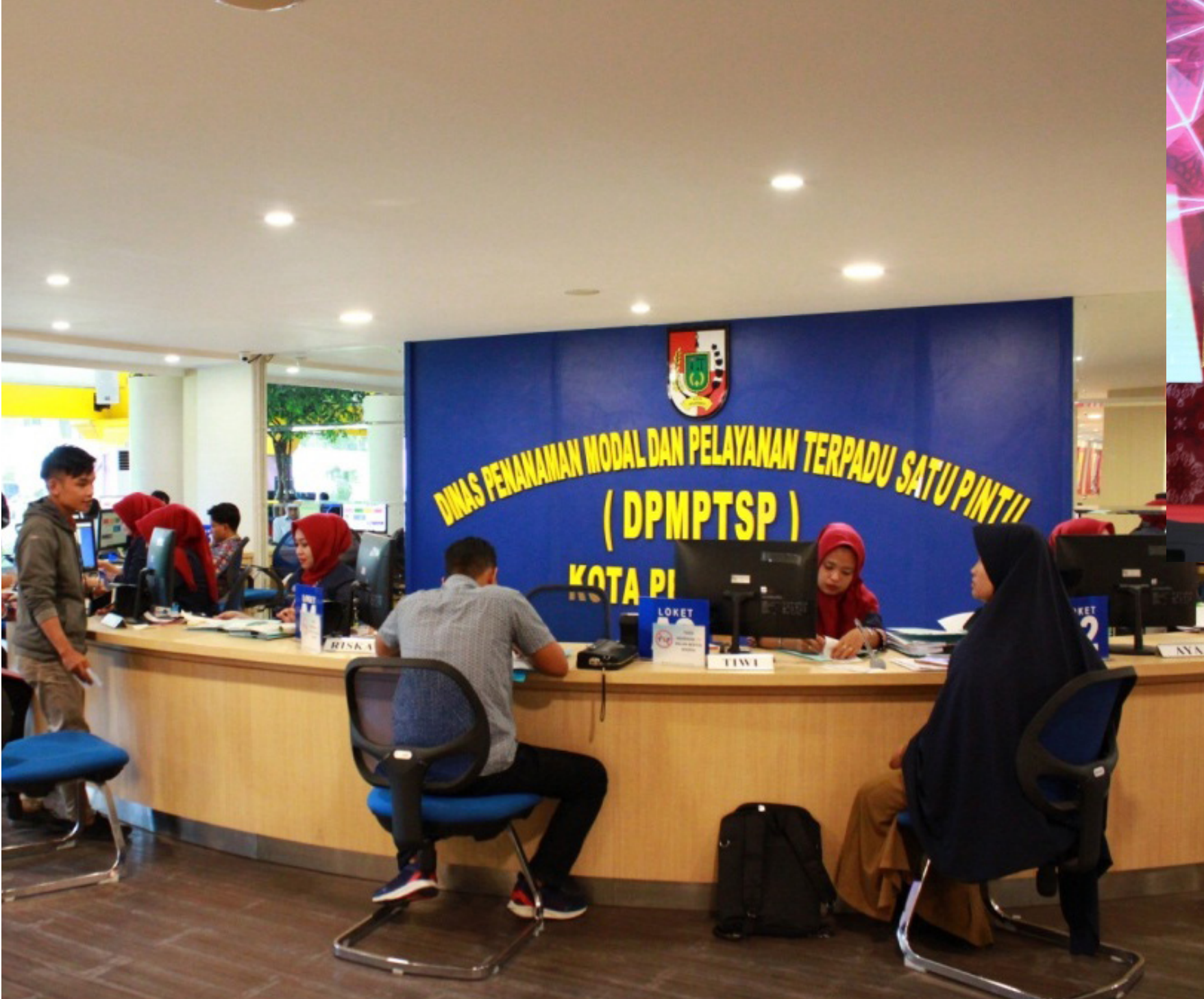
LAYANAN PERIZINAN - Dinas Penanaman Modal dan Pelayanan Terpadu Satu Pintu (DPMPTSP) Pekanbaru melayani perizinan dengan memanfaatkan teknologi informasi.

Menpan RB Tjahjo Kumolo mengingatkan birokrasi harus dipangkas untuk lebih cepat dalam penanaman investasi termasuk di masa pandemi guna meningkatkan ekonomi nasional. Semangat tersebut diaplikasikan Pemko Pekanbaru dimana pelayanan publik tetap berjalan baik di masa pandemi melalui sistem daring.