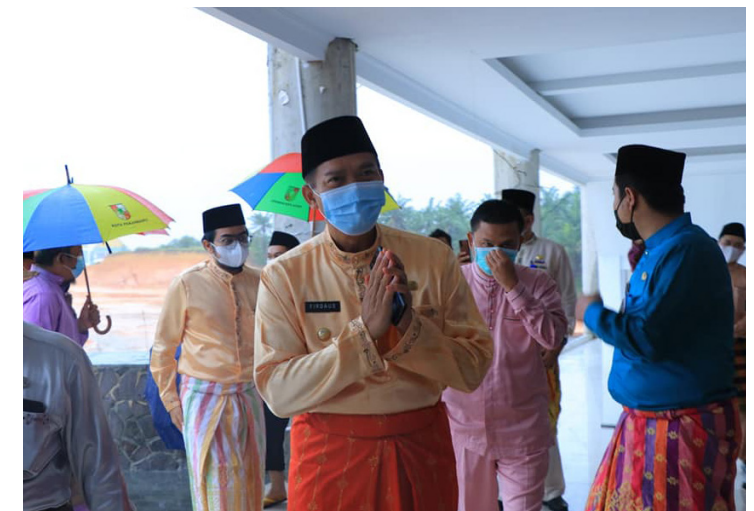
SAPA TAMU - Walikota Pekanbaru Dr H Firdaus ST MT menyapa sejumlah tamu undangan saat memasuki Islamic Center, lokasi acara pembukaan MTQ ke-53 tingkat Kota Pekanbaru 2021.