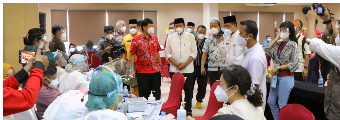
PROSES VAKSINASI - Walikota Pekanbaru Dr H Firdaus ST MT didampingi Kepala Dinas Kesehatan Kota Pekanbaru meninjau pelaksanaan vaksinasi massal bagi para lansia di Hotel Furaya.

sinasi, agar penyuntikan vaksin tidak terjadi penumpukan," ujarnya.