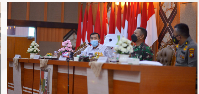
EVALUASI COVID - Walikota Pekanbaru Dr H Firdaus ST MT memimpin Rapat Evaluasi Penanganan Covid-19 bersama Satgas Penanganan Covid-19 Kota Pekanbaru dan OPD terkait.