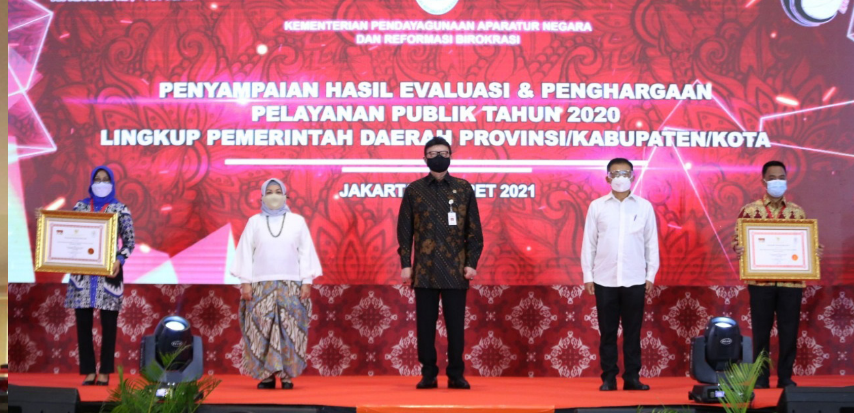
BERSAMA MENPAN - Penerima penghargaan pelayanan publik terbaik foto bersama Menpan RB Tjahjo Kumolo usai menerima penghargaan di Jakarta.