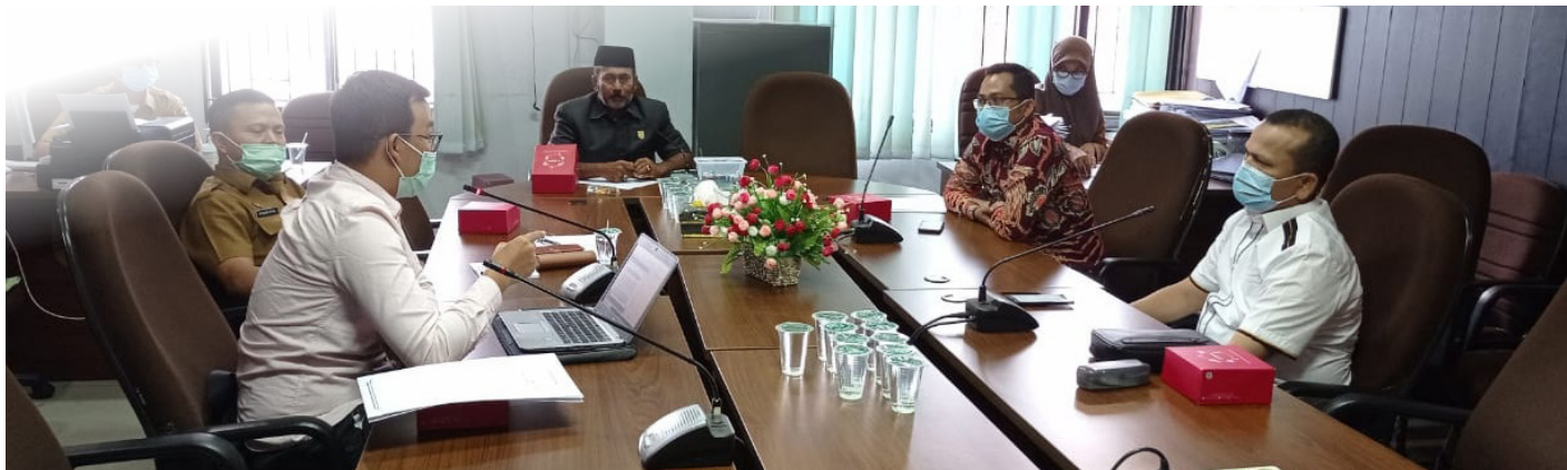
BAHAS PREMIUM - Komisi II DPRD Pekanbaru membahas kelangkaan premium di sejumlah SPBU bersama Pertamina dan Disperindag.