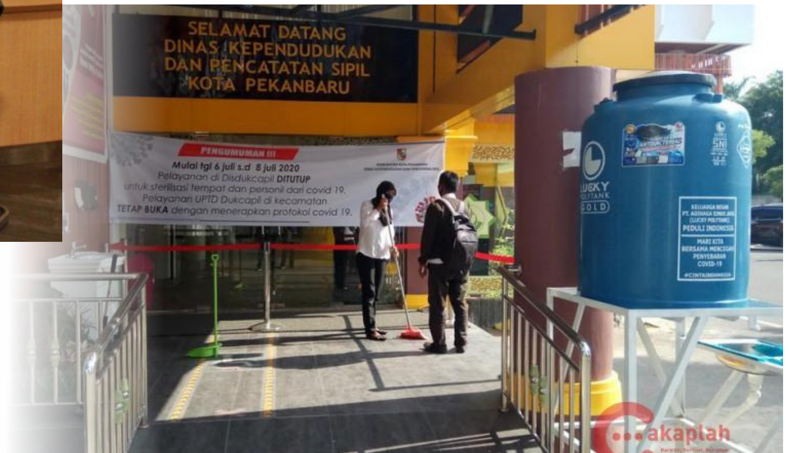
TERAPKAN PROKES - Pelayanan administrasi kependudukan di Disdukcapil Kota Pekanbaru di tengah pandemi tetap dibuka dengan menerapkan protokol kesehatan secara ketat.