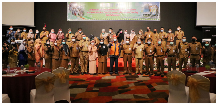
SOSIALISASI STUNTING - Wakil Walikota Pekanbaru H Ayat Cahyadi SSi membuka sosialisasi stunting dengan lintas sektor dan pembentukan tim pencegahan dan penanganan stunting di Hotel Premiere Pekanbaru.