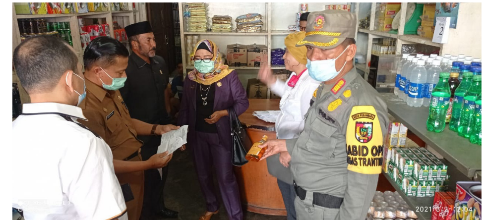
SIDAK MIRAS - Komisi II DPRD Pekanbaru bersama tim yustisi memperlihatkan miras yang dijual di Toko Budi Jalan Juanda saat sidak.

Terlebih lagi, peredaran miras bebas ini tidak sesuai dengan marwah dan gaya hidup masyarakat Melayu,